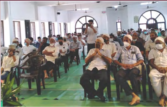
مورخہ 12 دسمبر 2021ء کو مجلس انصار اللہ ملاپورم (کیرلہ) کی طرف سے منعقدہ تربیتی اجلاس کے موقع پر حاضر اراکین انصار اللہ کا ایک منظر