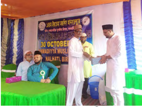
(تقسیم انعامات کا ایک منظر)

تشریف لائے۔ مکرم حضرت علی صاحب کی تلاوت قرآن کریم سے اجلاس کا آغاز ہوا۔ خاکسار نے عہد انصار اللہ دہرایا۔ پھر نظم کے بعد خاکسار نے شکریہ احباب پیش کیا۔ بعد صدر اجلاس نے انصار کو اپنی ذمہ داریوں کی طرف توجہ دلائی۔ اس کے بعد علمی مقابلہ جات میں نمایاں پوزیشن حاصل کرنے والے انصار کے مابین انعامات تقسیم کئے گئے۔ بعد اجتماعی دعا کے ساتھ اجتماع اختتام کو پہنچا۔ الحمد للہ۔