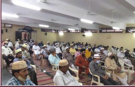
مورخہ 19 اکتوبر 2021ء کو مسجد احمد سعید آباد میں منعقدہ سالانہ اجتماع مجلس انصار اللہ حیدرآباد (تلنگانہ) کے اختتامی اجلاس کے موقع پر حاضر اراکین مجلس انصار اللہ حیدرآباد کا ایک منظر