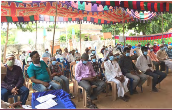
مورخہ 9 اکتوبر 2021ء کو کنڈور میں منعقدہ سالانہ اجتماع مجلس انصار اللہ ضلع ورنگل (صوبہ تلنگانہ) کے افتتاحی اجلاس کے موقع پر حاضر اراکین مجلس انصار اللہ ورنگل